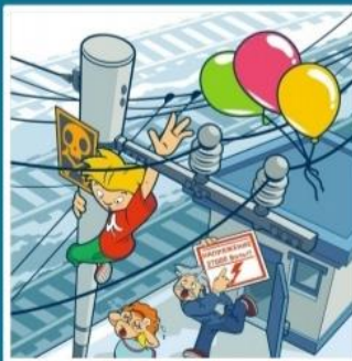
Приближаться к проводам меньше чем на 2 метра - смертельно опасно!