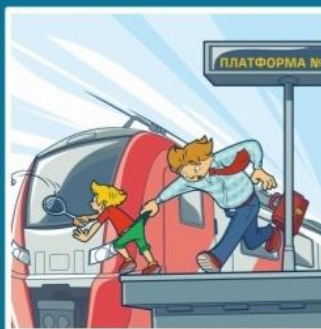
Платформа - не место для игр!